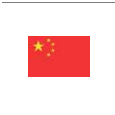
ZHANG YANG , Cina