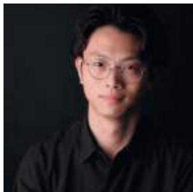
YAMADA IO , Giappone