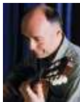
CARLOS BONELL UK