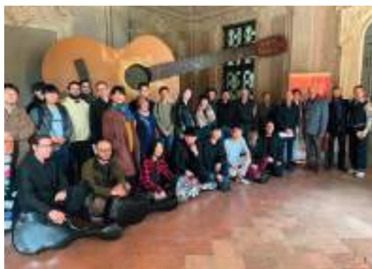
2022 Edition , Candidates and jurors