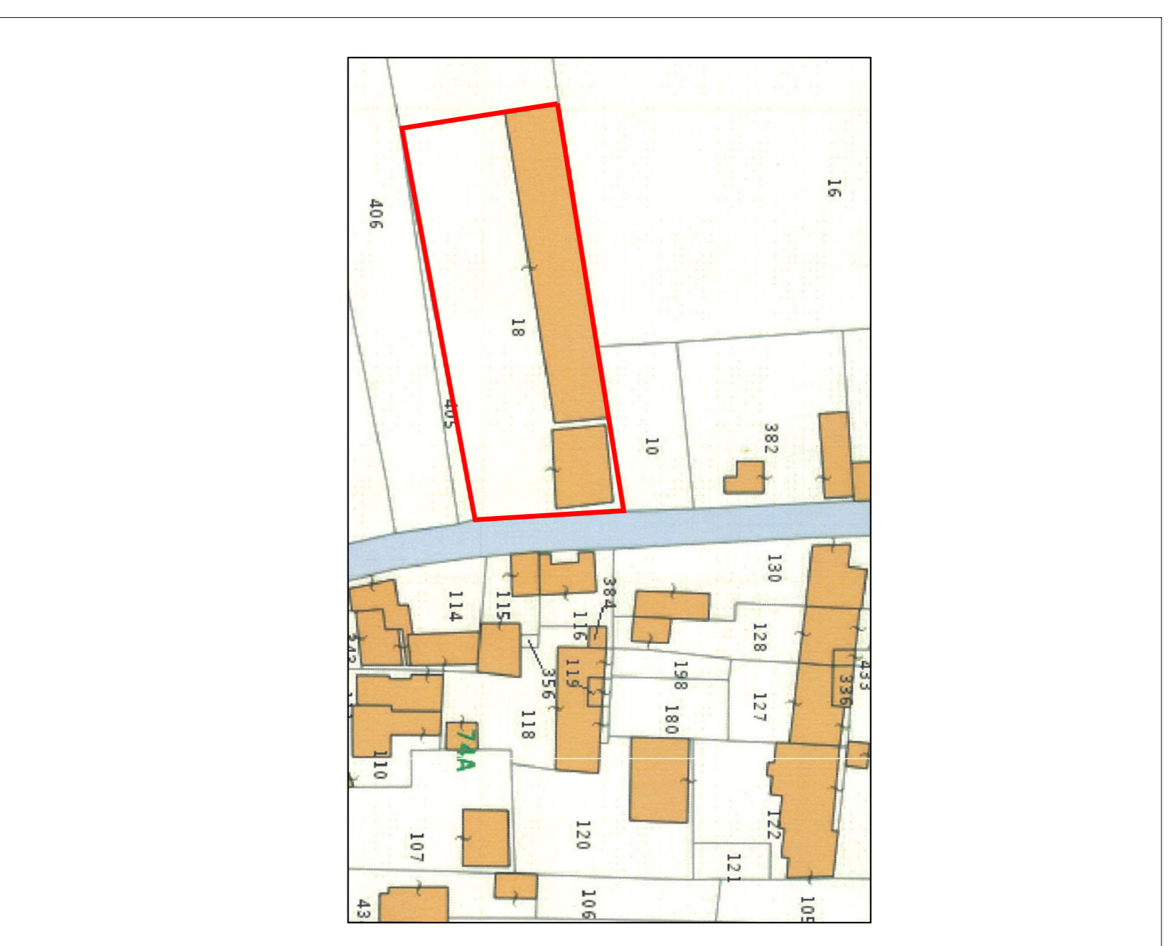
Estratto catastale N.C.E.U. Foglio 74 Mappali 18 - 405 e parte del 406 Individuazione dell'area oggetto di intervento Scale 1:1000