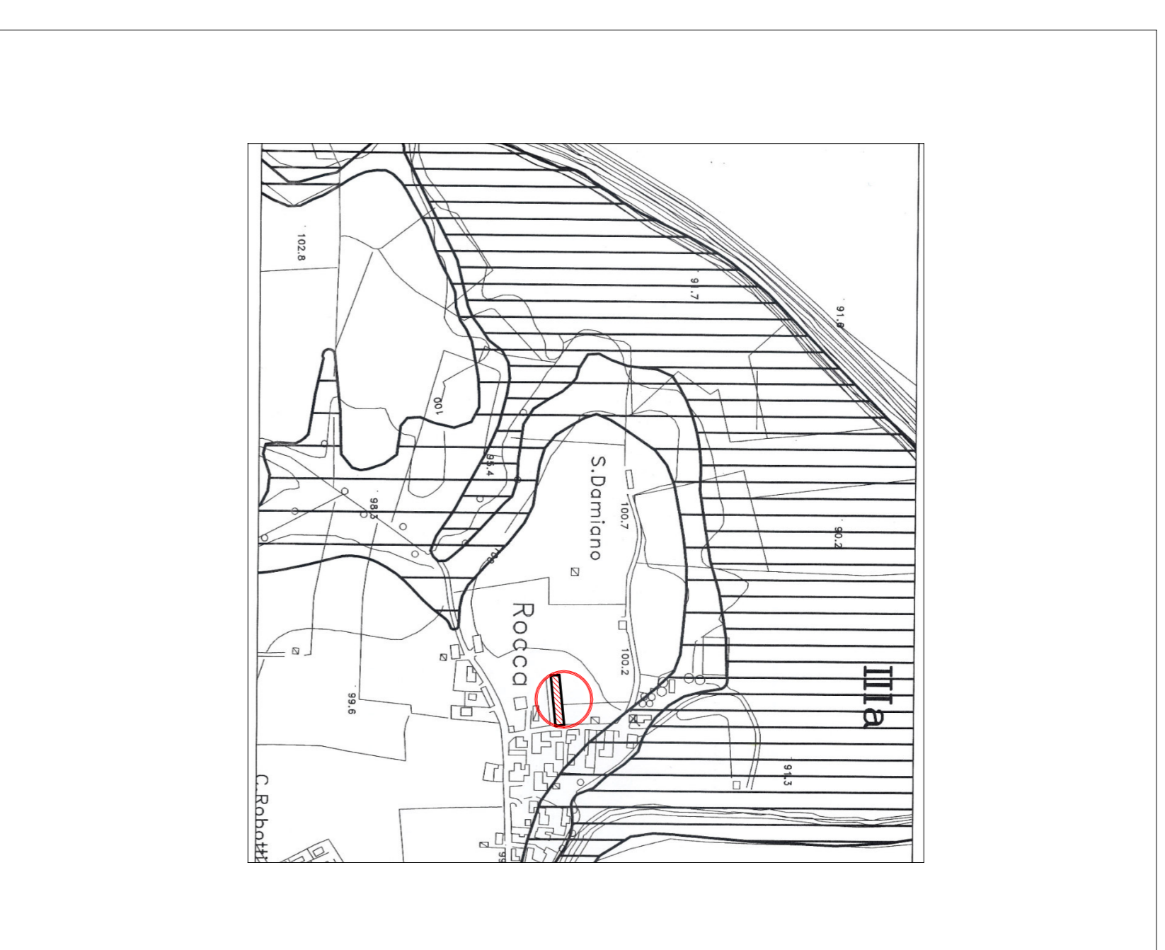
Zoomizzazione in classi di pericolosità geomorfologica Tav.2 Classe 1 Scale 1:1000