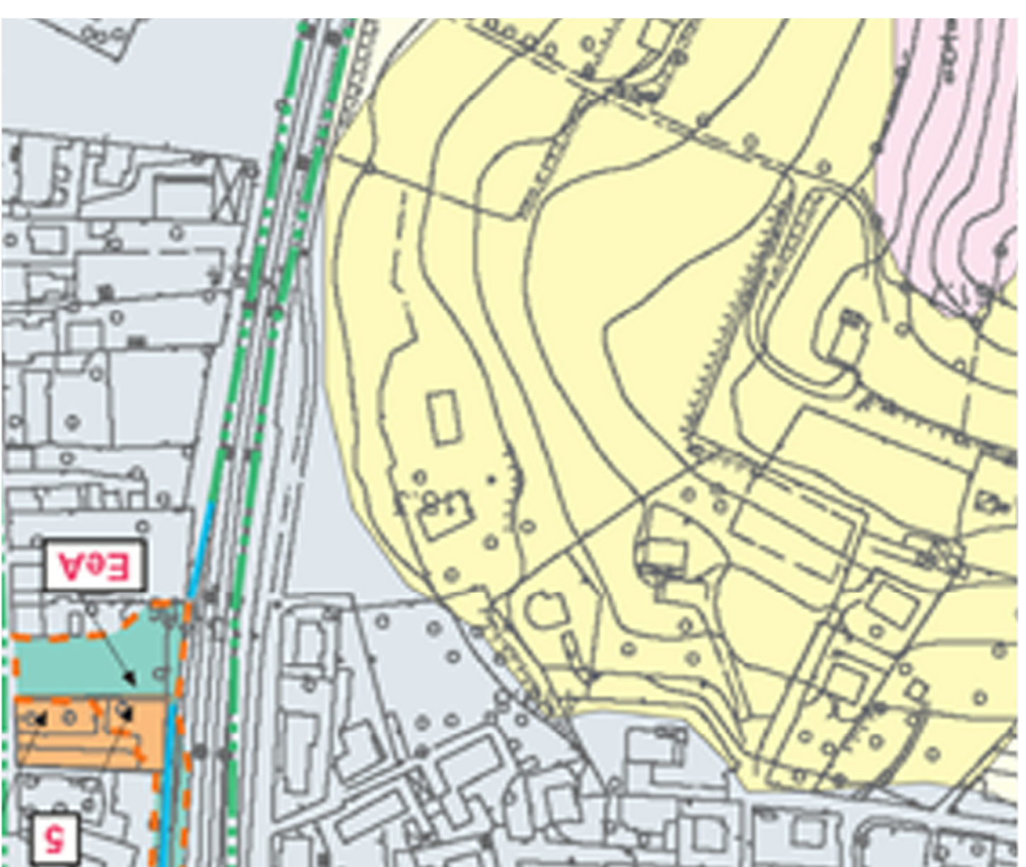
Estratto carta di sintesi pericolosità geomorfologica