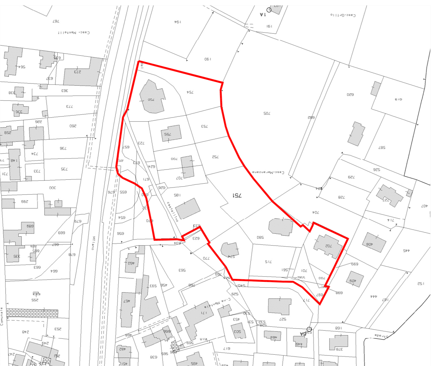
Estratto catastale con perimetrazione P.E.C.