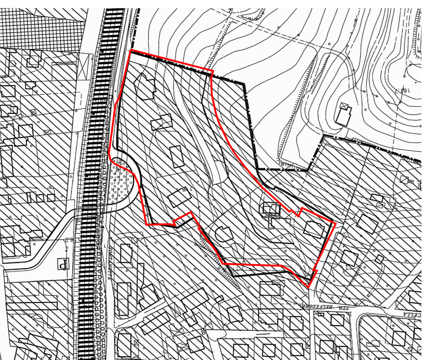
Estratto P.R.G.C. con perimetrazione P.E.C.