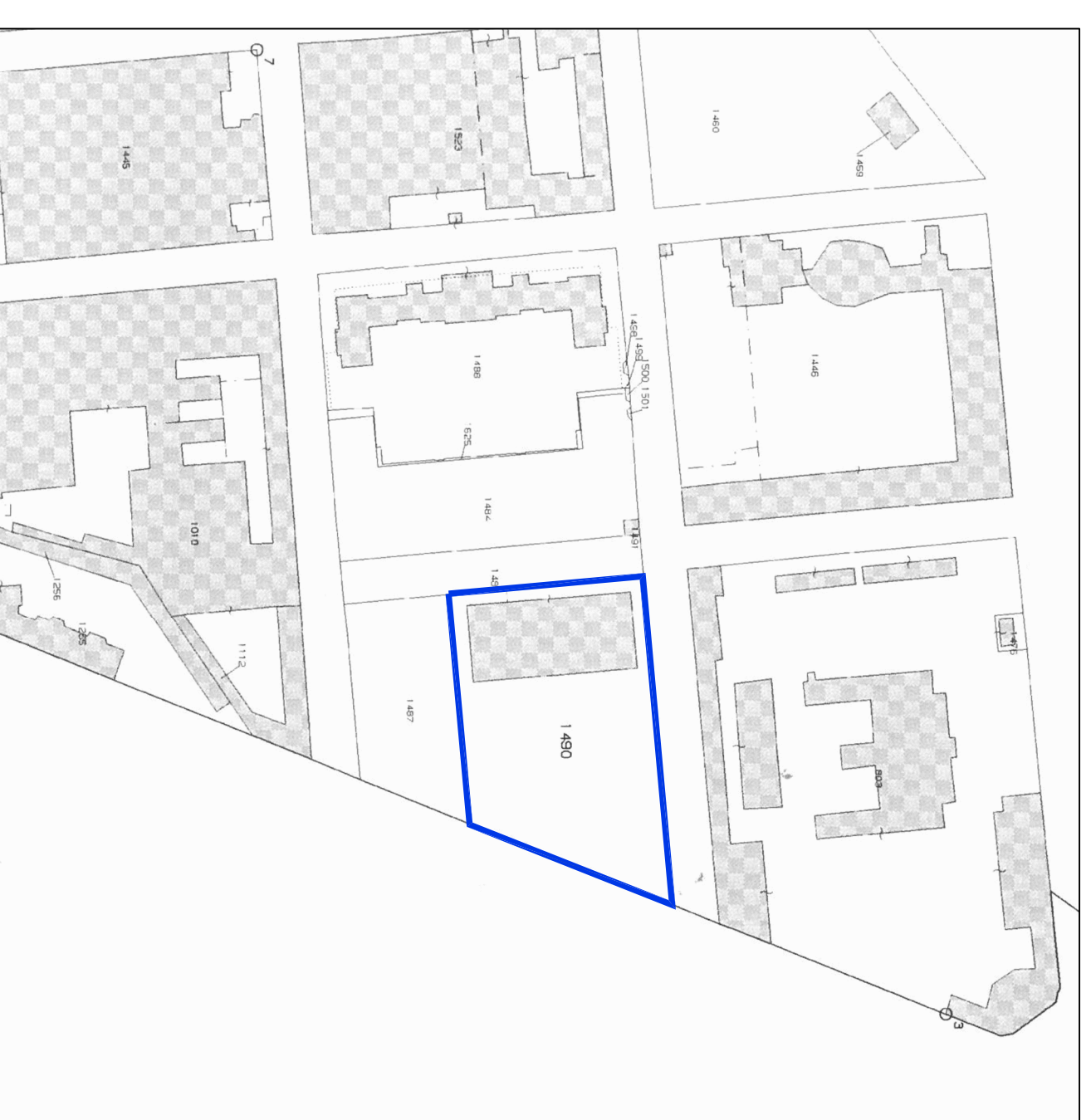
Fig.118 mapp. 1490