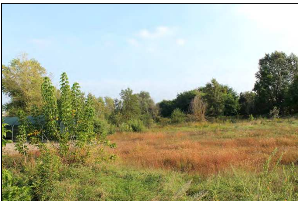
24 – Vista da Via Vecchia Torino verso la ferrovia