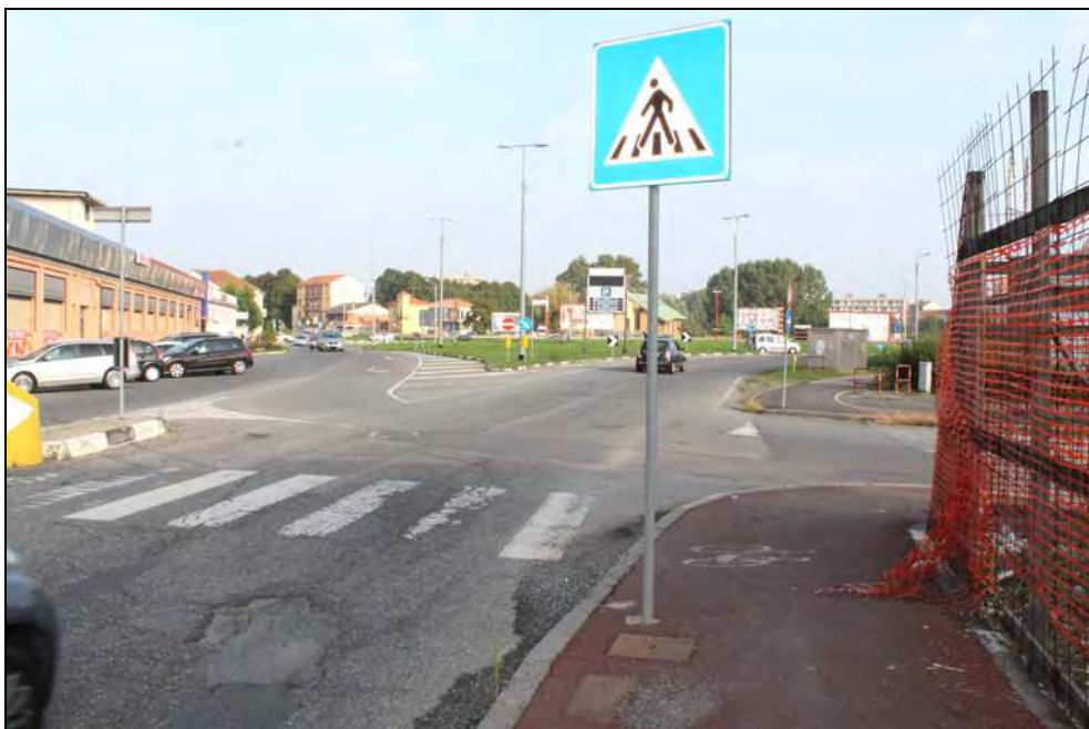
10 - Immissione di Via G. Bruno in rotatoria, con intersezione con Via Vecchia Torino ed attraversamento pedonale a raso