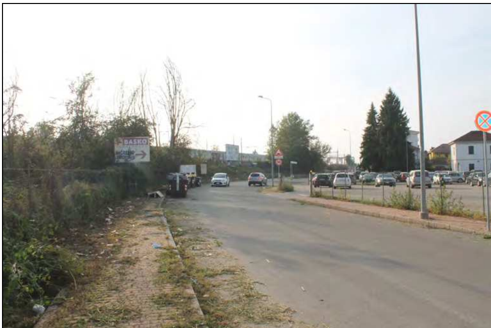
14 – Tratto della via prospiciente la linea ferroviaria, con traversa diretta verso Via G. Bruno sulla destra