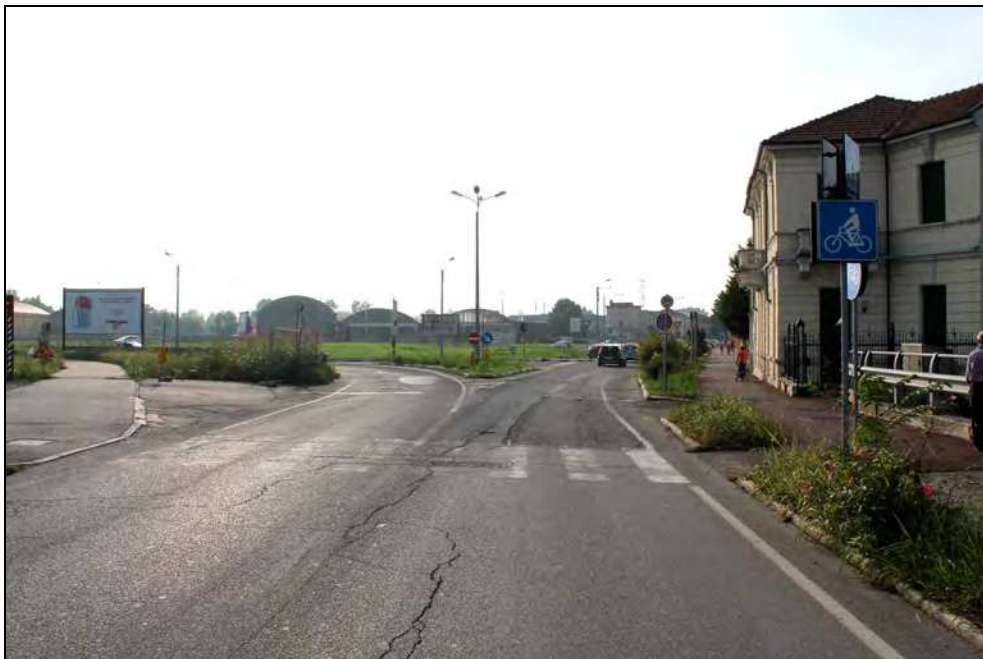
8 - Immissione di Via G. Bruno - lato Cittadella nella rotatoria, con passaggio ciclo-pedonale a raso