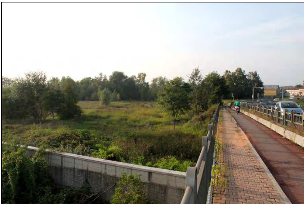
19 – Vista dell'area oggetto del PEC e della ripa presente a lato dell'imbocco al ponte Tiziano