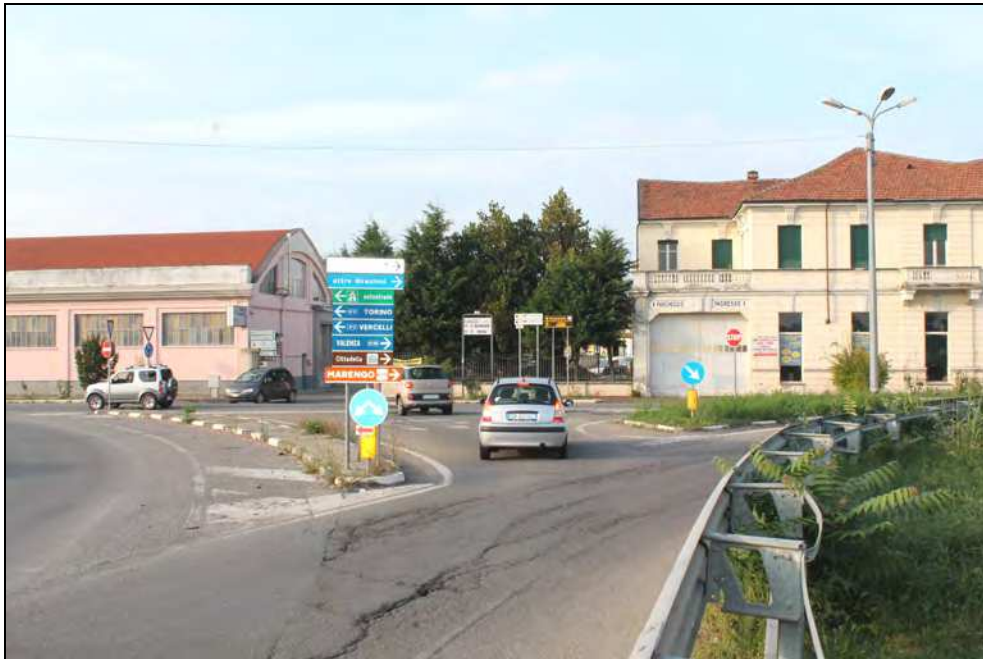
5 - Ramo di uscita verso Via G. Bruno lato Cittadella, con corsia riservata su isola spartitraffico per accesso alle attività artigianali e commerciali antistanti la rotonda