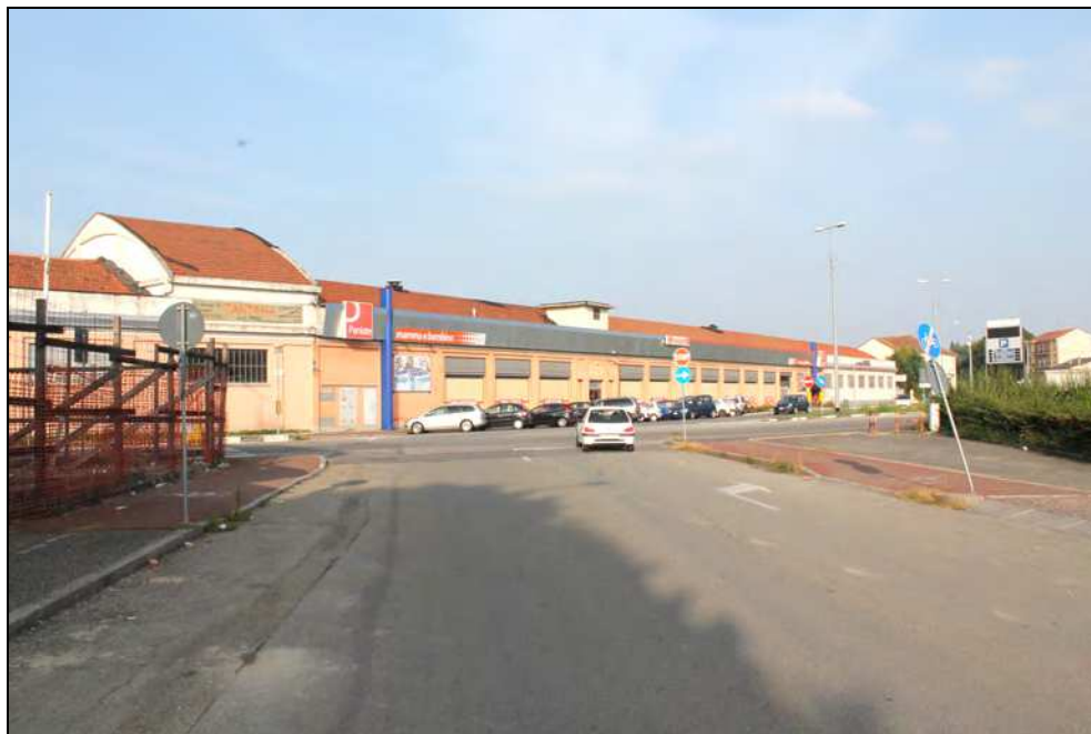
11 - Tratto terminale di Via Vecchia Torino prima dell'incrocio con Via G. Bruno