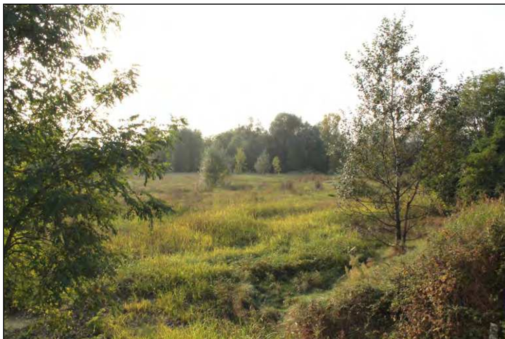
21 – Vista del sito di intervento dal ponte Tiziano verso la linea ferroviaria