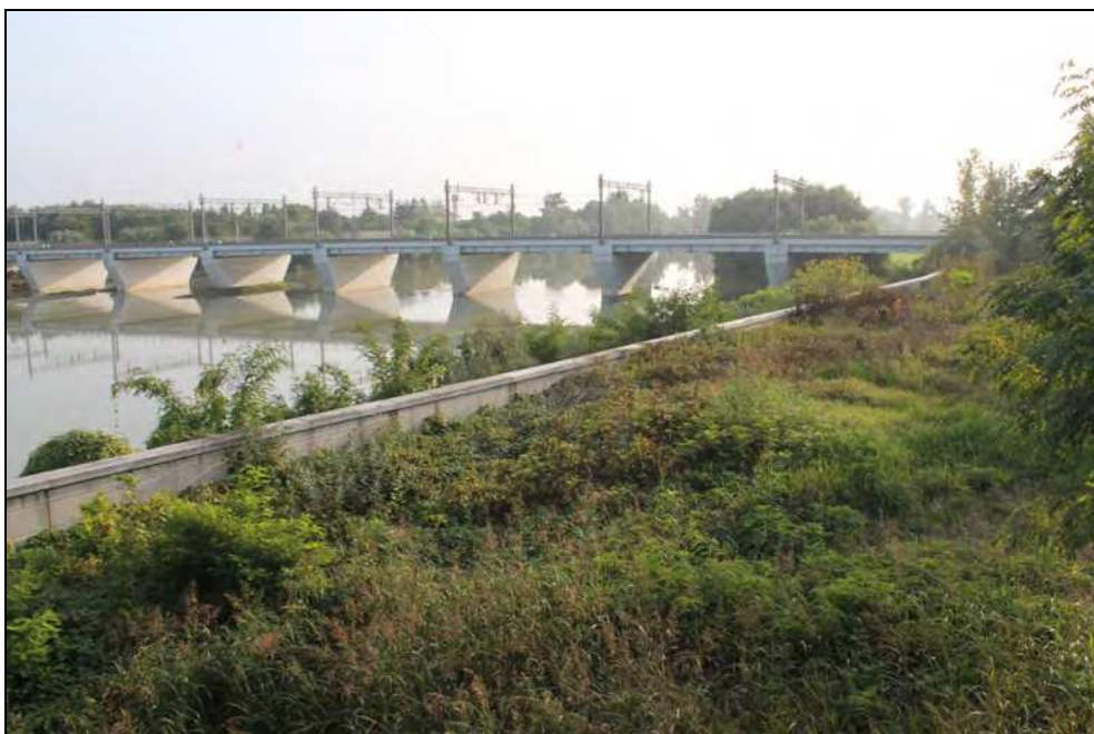
20 – Muro d'argine in sinistra Tanaro a chiusura dell'area di intervento e sullo sfondo il ponte (nuovo) della ferrovia