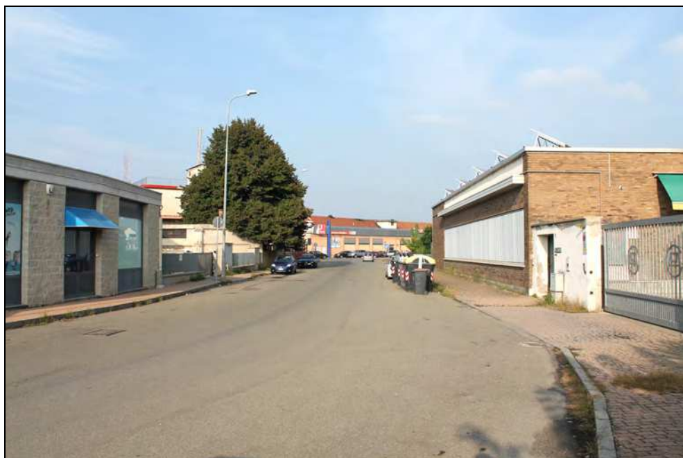
16 – Vista del tratto adiacente al Consorzio Agrario in direzione Via G. Bruno