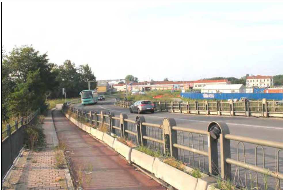
18 – Vista del ponte, con relativo marciapiede e pista ciclabile, e del tratto di Via compreso fra il ponte e la rotonda di piazzale Alba Iulia