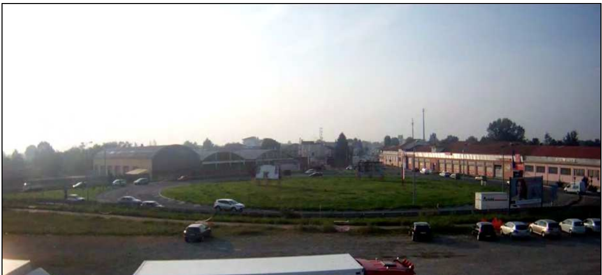
6 - Vista dall'alto (dal piazzale antistante la Chiesa SS. Annunziata) dell'intera rotonda