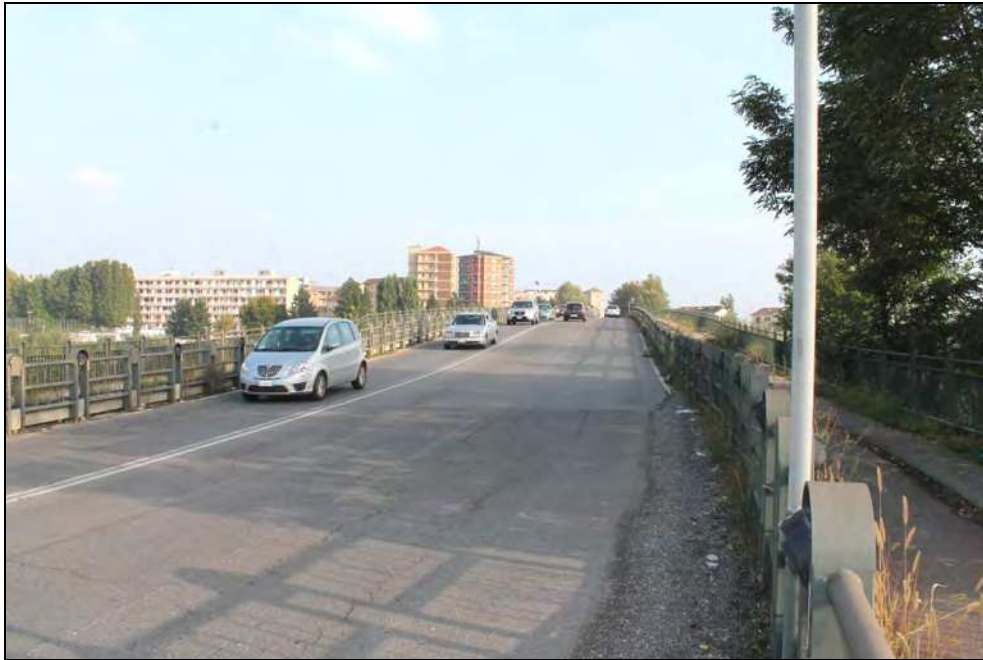
17 – Salita verso il ponte Tiziano