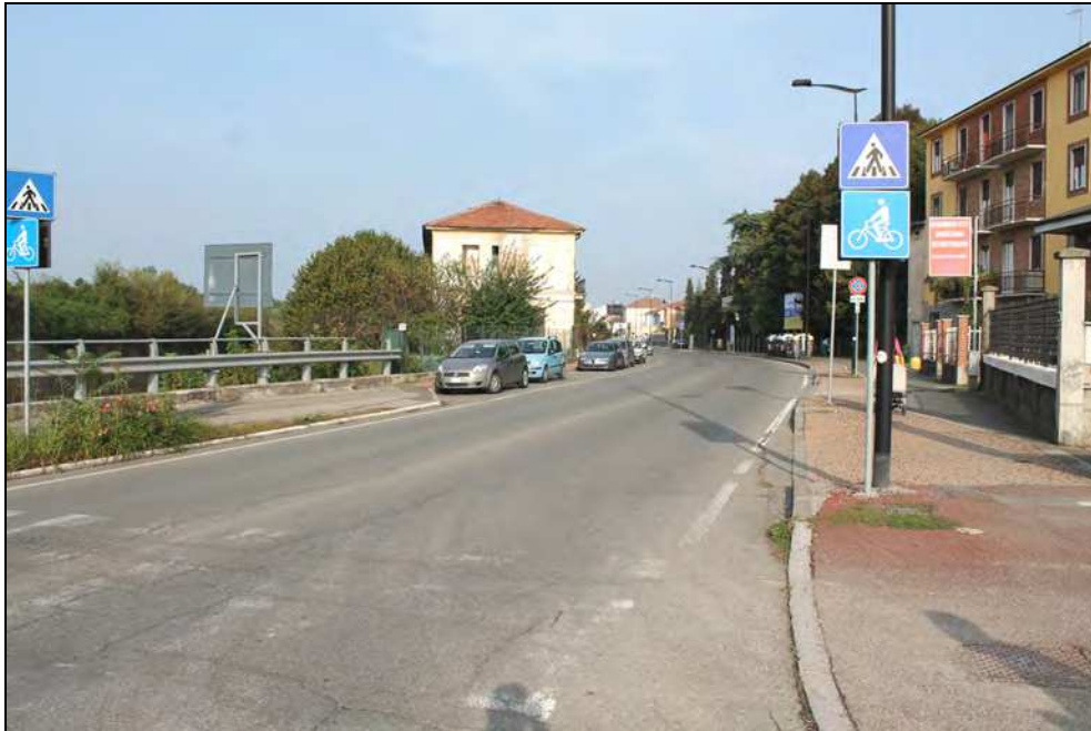
7 - Via G. Bruno dal lato della Cittadella