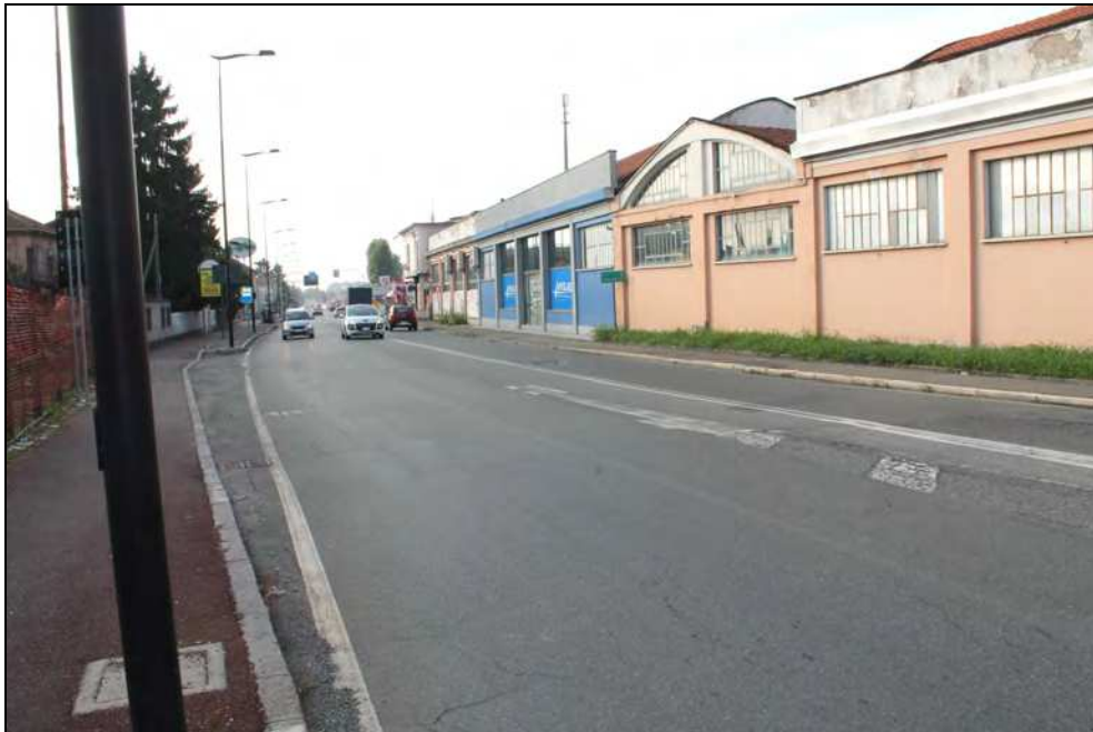
9 - Via G. Bruno dal lato occidentale, verso Asti