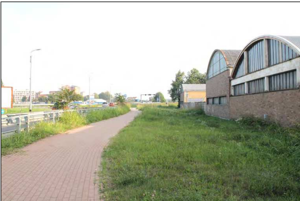
4 – Pista ciclo-pedonale fra la rotatoria ed il Consorzio Agrario