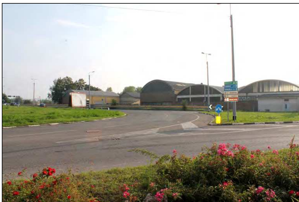
2 –Vista dell'uscita dalla rotatoria verso Via Giordano Bruno