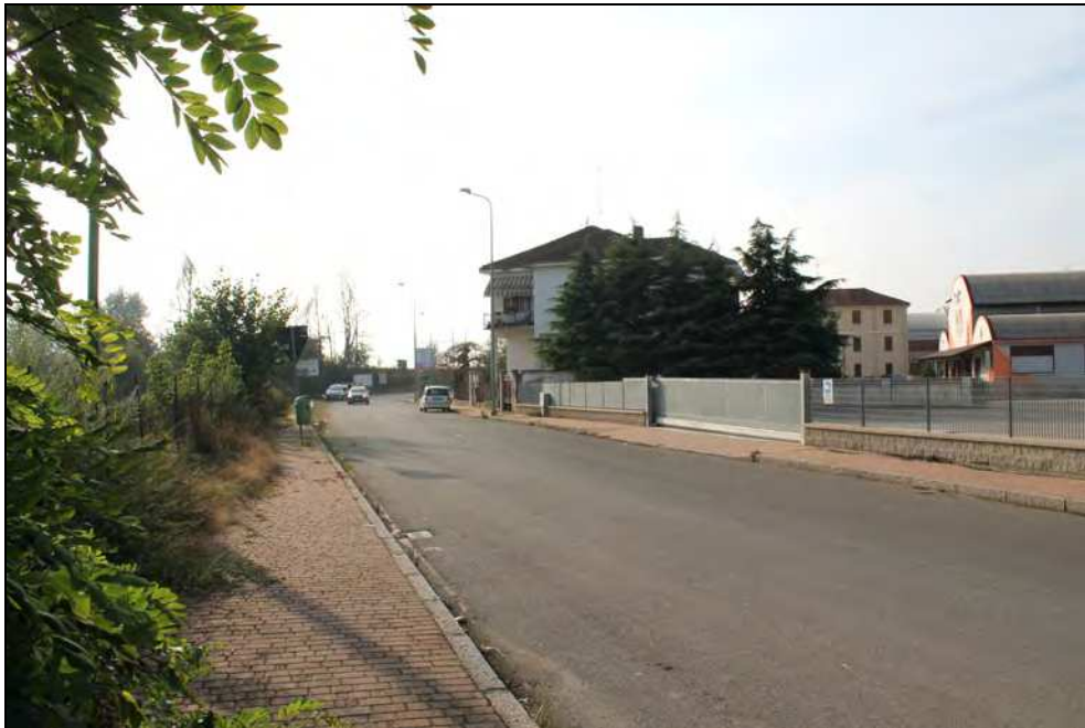
13 – Tratto intermedio di Via Vecchia Torino verso la ferrovia