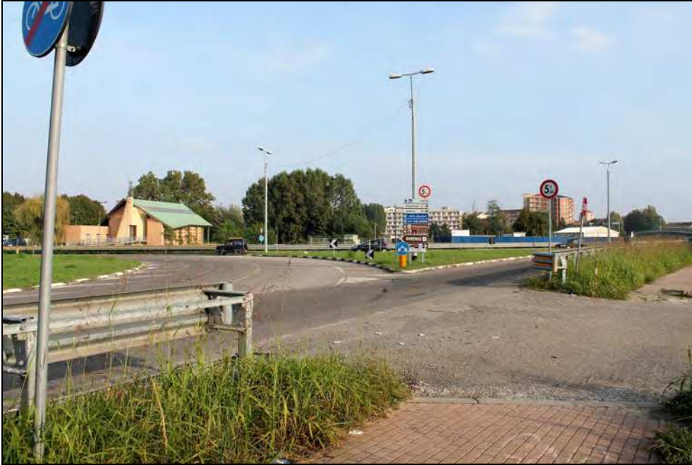
3 – Vista dell'accesso carraio del Consorzio Agrario sulla rotatoria, prima dell'uscita verso il ponte Tiziano