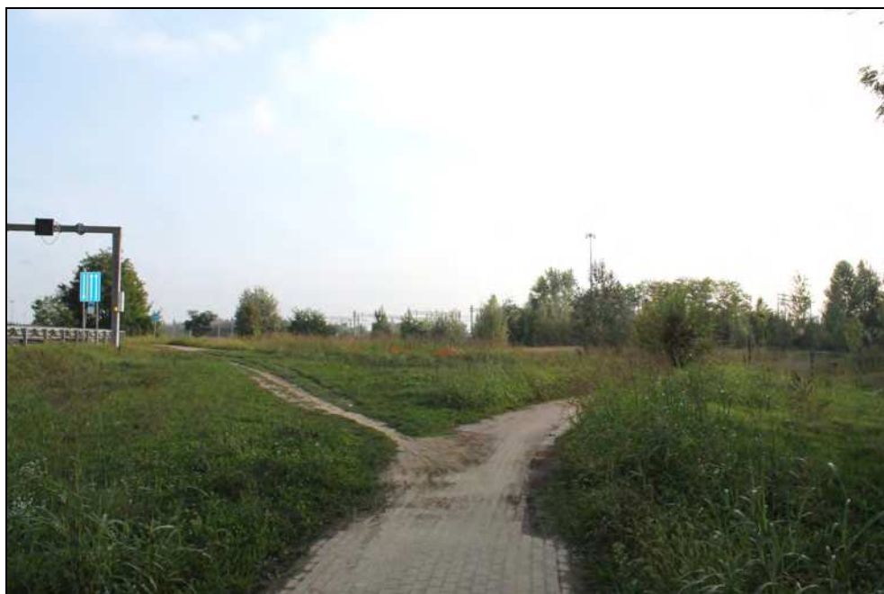
22 – Deviazione della pista ciclabile attuale verso il ponte Tiziano e prosecuzione nell'area di intervento