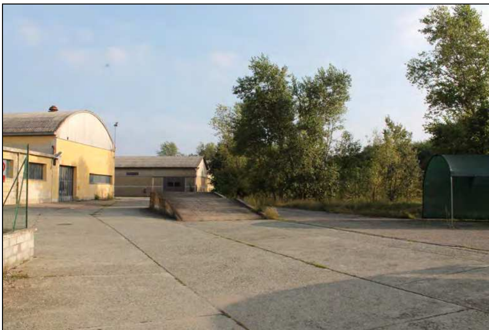
23 – Piazzali interni al Consorzio Agrario e relative costruzioni