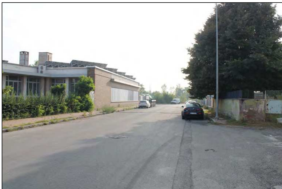
12 - Via Vecchia Torino nel tratto adiacente al Consorzio Agrario