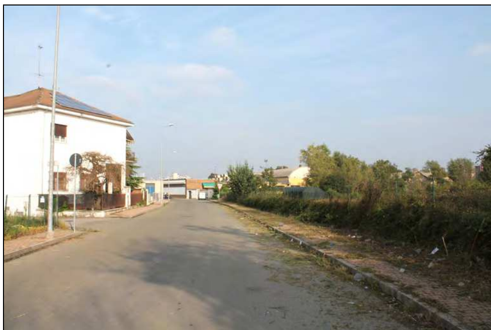
15 – Vista della via adiacente all'area del Consorzio dalla zona della linea ferroviaria