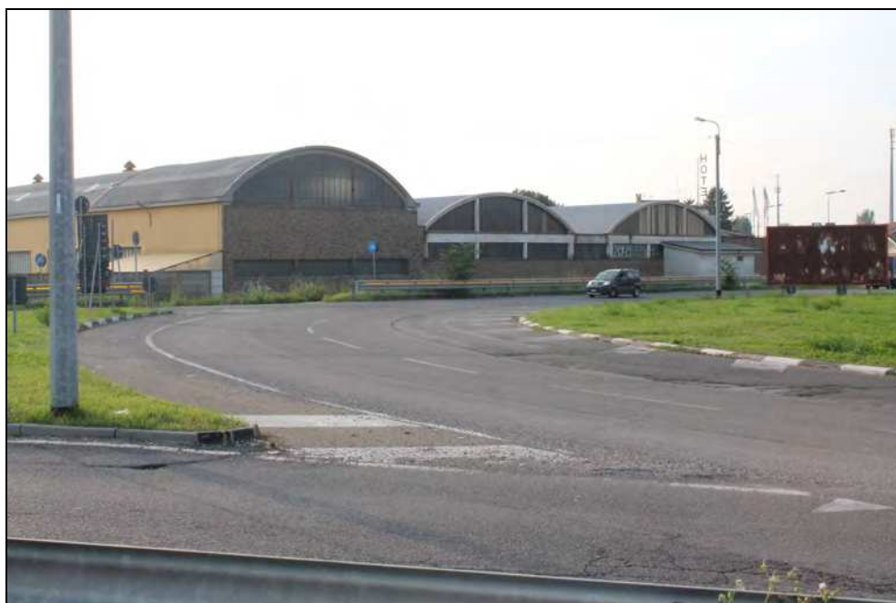
1 –Vista della corona giratoria da Sud e sullo sfondo i capannoni del Consorzio Agrario