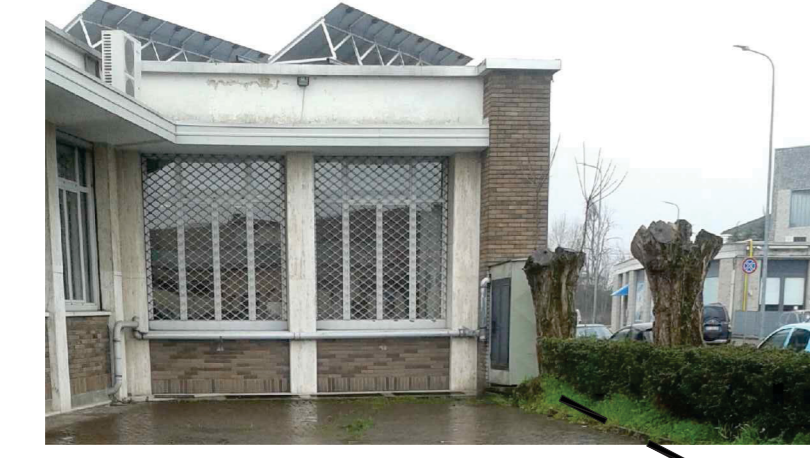
Attuale punto di consegna del gas metano al Consorzio Agrario